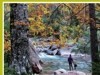
Medio Ambiente y Cambio Climático