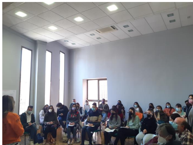
Foto 2. Dinámica de presentación de las asociaciones y entidades presentes.

A continuación, tuvo lugar una dinámica rompehielos en la que los asistentes se conocieron entre ellos de una manera informal.