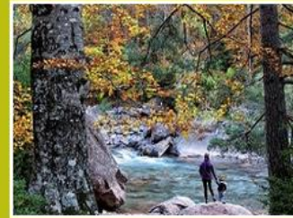
Medio Ambiente y Cambio Climático