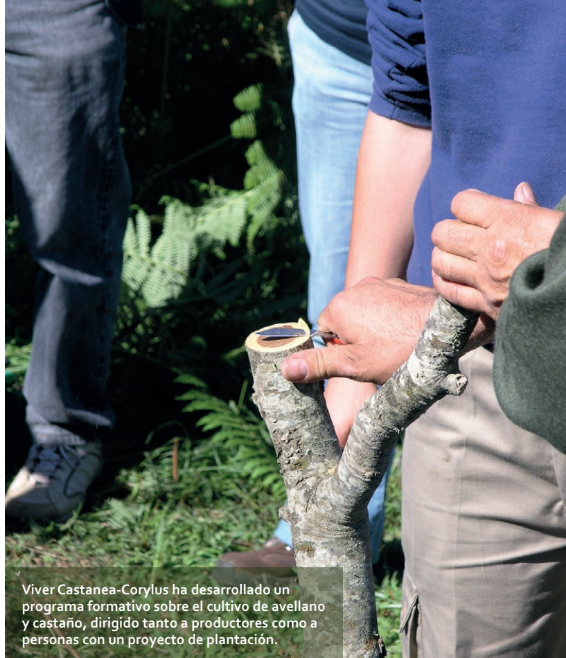
Viver Castanea-Corylus ha desarrollado un programa formativo sobre el cultivo de avellano y castaño, dirigido tanto a productores como a personas con un proyecto de plantación.

temporal itinerante por toda Asturias y un canal online ; la investigación sobre técnicas de creación de variedades autóctonas de castaño y avellano; la elaboración de dos publicaciones de buenas prácticas sobre la explotación del castaño y avellano, en papel y formato digital; el desarrollo de estudios de viabilidad para la creación de viveros de castaño y avellano; y la realización de seminarios para acercar el proyecto al público.