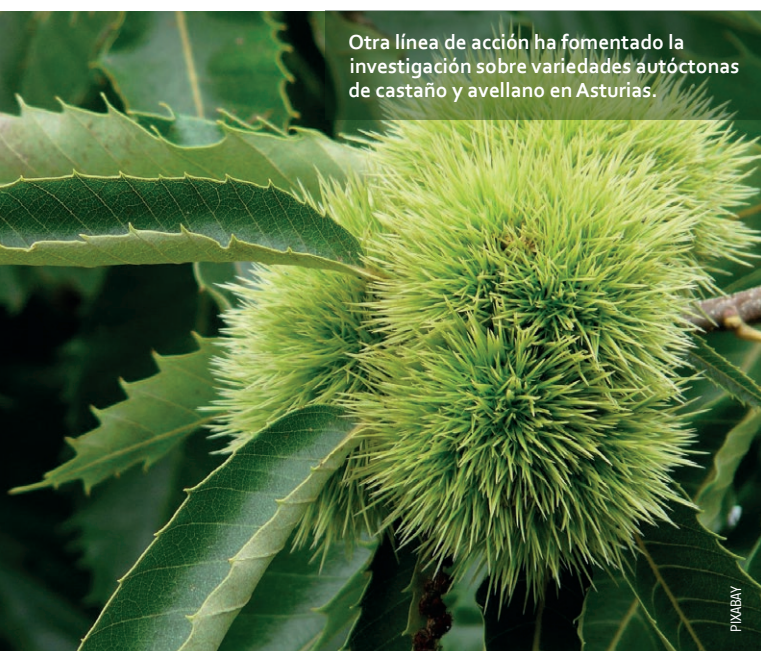
Otra línea de acción ha fomentado la investigación sobre variedades autóctonas de castaño y avellano en Asturias.