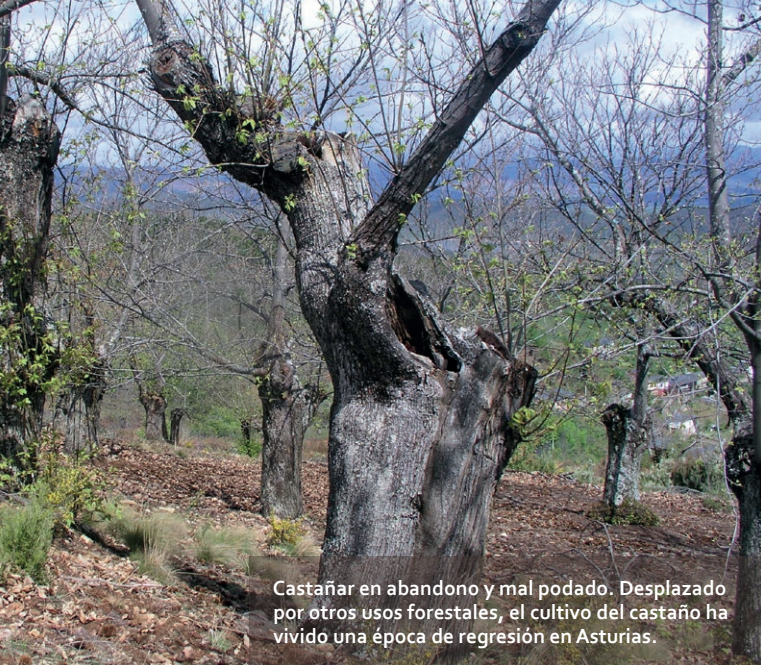
Castañar en abandono y mal podado. Desplazado por otros usos forestales, el cultivo del castaño ha vivido una época de regresión en Asturias.