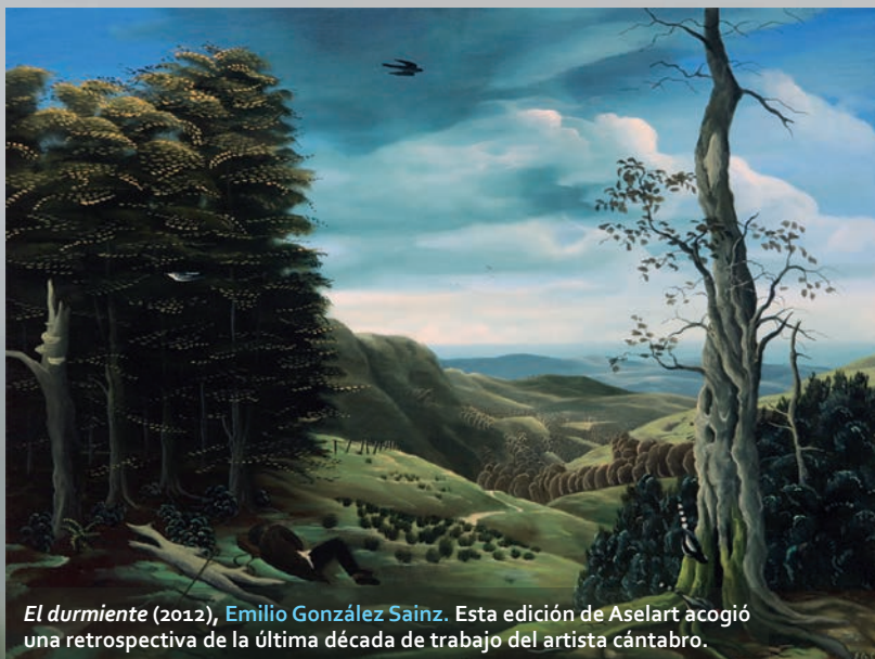
El durmiente (2012), Emilio González Sainz. Esta edición de Aselart acogió una retrospectiva de la última década de trabajo del artista cántabro.

Este 2021 no iba a ser menos y han renovado su alianza con la creación artística para alojar, junto a la vecina Herrera de Ibio, nuevas obras y propuestas en varios edificios públicos y en su bello entorno natural, en la cuenca del Saja. Durante todo el verano se sucedieron actuaciones musicales y teatrales, conferencias, presentaciones de libros, exposiciones de pintura o intervenciones de land-art , como la que colgó macrofotografías de varios antepasados de la villa a las puertas de sus casas. Traemos aquí una muestra de esta reciente celebración del arte en Mazcuerras, dos palabras que Aselart ha hecho casi inseparables. ■