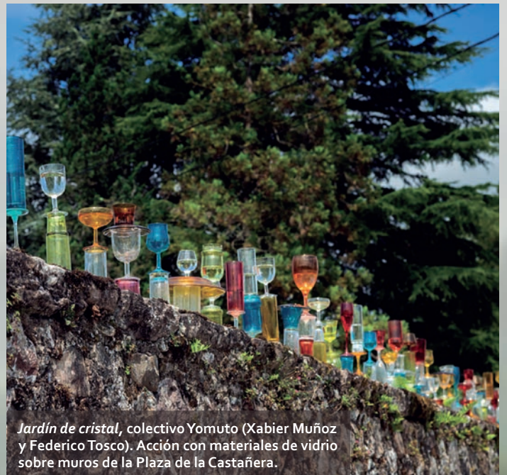
Jardín de cristal , colectivo Yomuto (Xabier Muñoz y Federico Tosco). Acción con materiales de vidrio sobre muros de la Plaza de la Castañera.